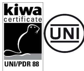
Certificato n. ... UNI/PdR 88:2020

Nell'utilizzo del marchio di certificazione il cliente deve soddisfare tutte le regole applicabili indicate nel " Regolamento Kiwa per la Certificazione " e quelle di seguito riportate.